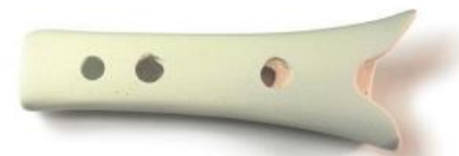
Tidldibab – replika 60.000 let stare piščali iz kosti