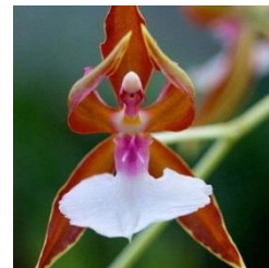
orhideja baletka (najdemo jo le v Avstraliji)

Orhideje so med najbolj ogroženimi rastlinami amazonskega deževnega gozda. Obstaja več kot 25.000 vrst orhidej in vse so ogrožene. Mnoge vrste že izumirajo. To so največje cvetoče rastline na svetu in prihajajo v najrazličnejših barvah in oblikah. Cvetovi orhideje so lahko večji od človeške roke in lahko zrastejo do nekaj metrov.