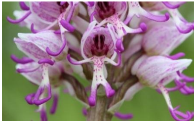
zgleda kot majhen človeček