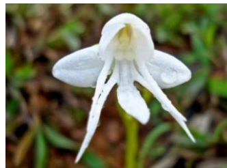
angelska orhideja (cveti le na Himalaji)