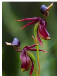
raca v letu