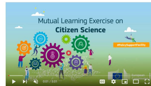
Citizen Science at the heart for research and innovation Unlisted