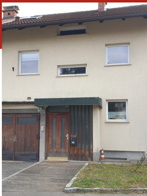
Hiša Ele Peroci za Bežigradom, Žolgerjeva 8