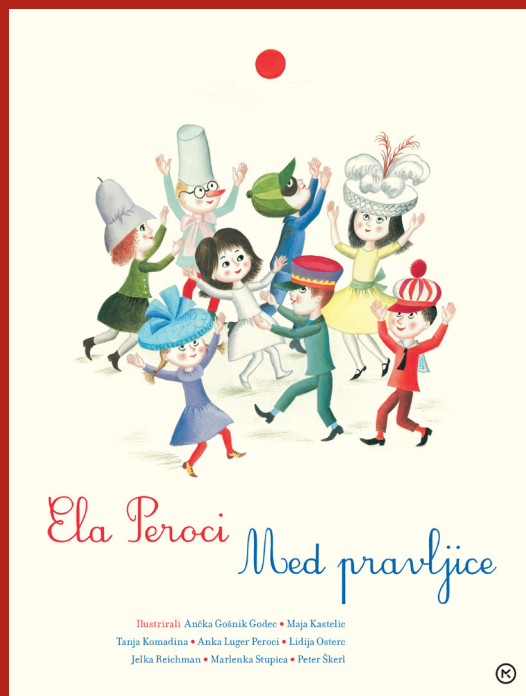
Naslovnica antologije Med pravljice, MKZ, 2022